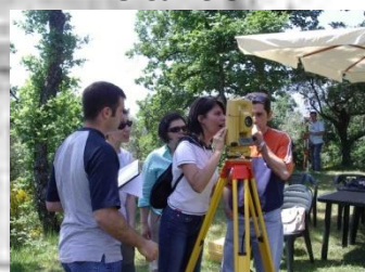
Esercitazioni e attività pratiche