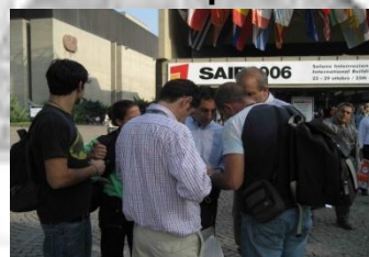
Partecipazioni a fiere e convegni