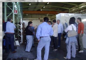
Visite in aziende e cantieri

OLTRE alle lezioni in aula si effettuano